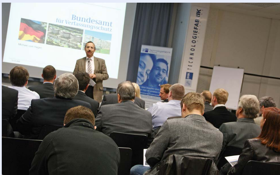
Die Teilnehmer wurden für Präventionsmaßnahmen sensibilisiert.

Unternehmerisches Know-how ist häufig die entscheidende Existenzgrundlage eines Unternehmens. Dies gilt auch für Kundenlisten und für technische Fertigkeiten oder Anwendungen. Im Zuge der Globalisierung ist die Gefahr der Wirtschaftsspionage, gerade auch für mittelständische Unternehmen,