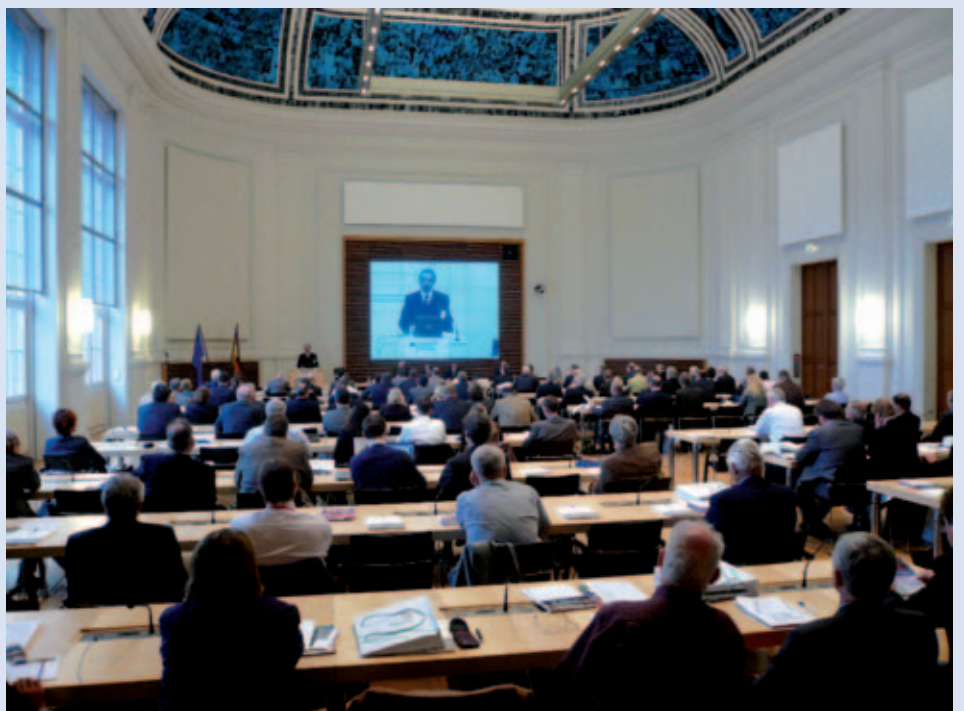
... begrüßte über 180 Teilnehmer, die sich im Rahmen der Jahreskonferenz intensiv austauschten.