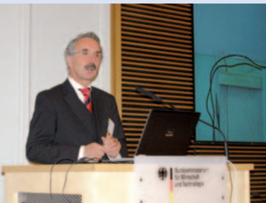
MdB Hartmut Schauerte, Parlamentarischer Staatssekretär beim BMWi und Beauftragter der Bundesregierung für den Mittelstand ...

der Wirtschaft war gelegt, denn diese Unternehmen wuchsen in den nächsten Jahren weiter und bilden den in Deutschland so starken unverzichtbaren Mittelstand. Als Dachverband der deutschen Innovations-, Technologie- und Gründerzentren feierte der ADT-Bundesverband im September sein 20-jähriges Jubiläum. Im Rahmen der internationalen Konferenz vom 22. – 23. September wurde in Berlin auf die Erfolgsgeschichte der Zentren in Deutschland und auch auf die Perspektiven für die Zukunft eingegangen. Zu dieser Jubiläumsveranstaltung, die gemeinsam von ADT und dem Bundeswirtschaftsministerium ausgerichtet wurde, erschienen zahlreiche internationale Partner. Aus diesem Grund bildete auch das Thema Internationalisierung einen Schwerpunkt auf der Agenda.