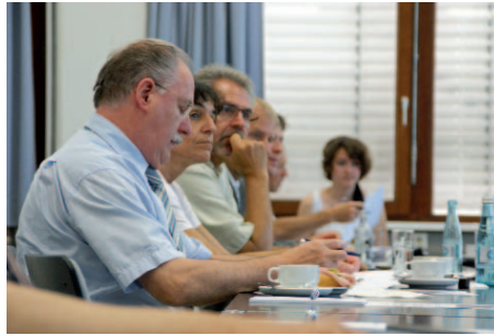
Viele Ideen und interessante Ansätze wurden während des Workshops entwickelt.