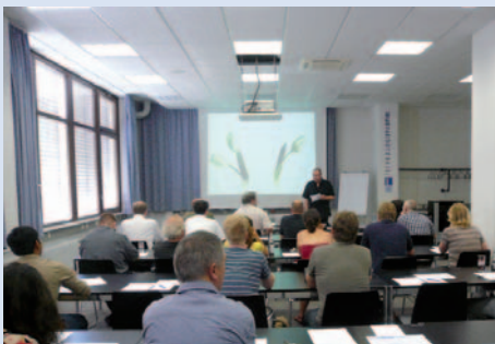
Viel Wissenswertes rund um das Thema Foto und Kommunikation wurde im Seminar vermittelt