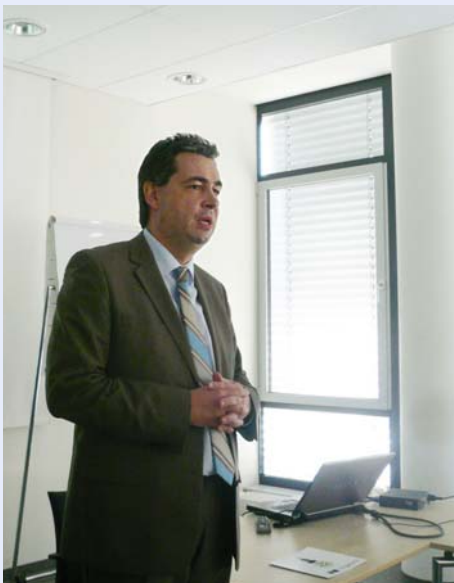
Bild oben: Empfang die Teilnehmer des Workshops: Bürgermeister Dietmar Allgaier