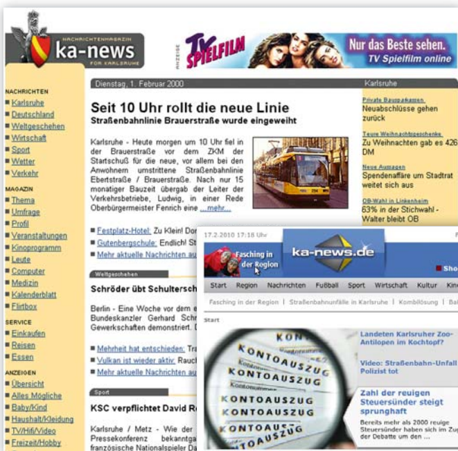
Heute ist das Nachrichtenportal aus Karlsruhe nicht mehr wegzudenken.